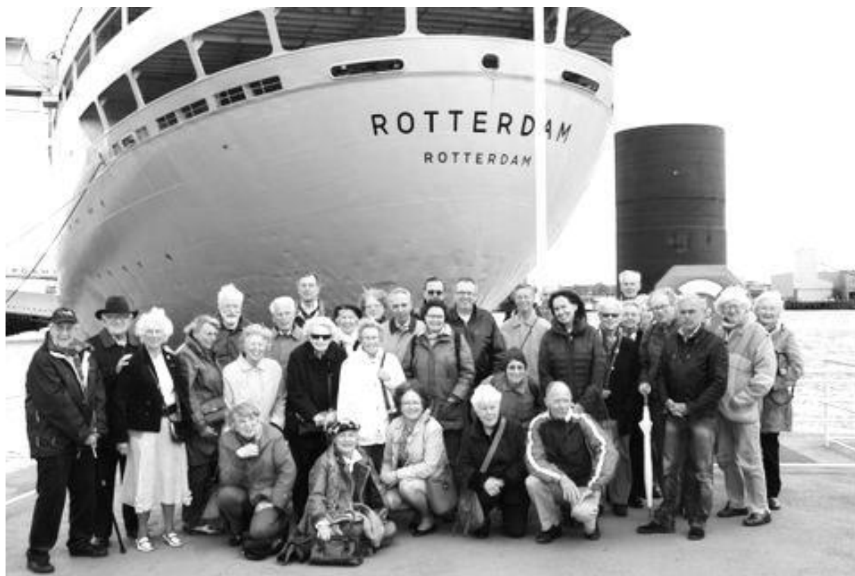
Het gezelschap poseert voor de indrukwekkende achtersteven

12 mei Excursie naar het SS Rotterdam, gevolgd door een rondvaart met de party-rondvaartboot Ostara door het havengebied