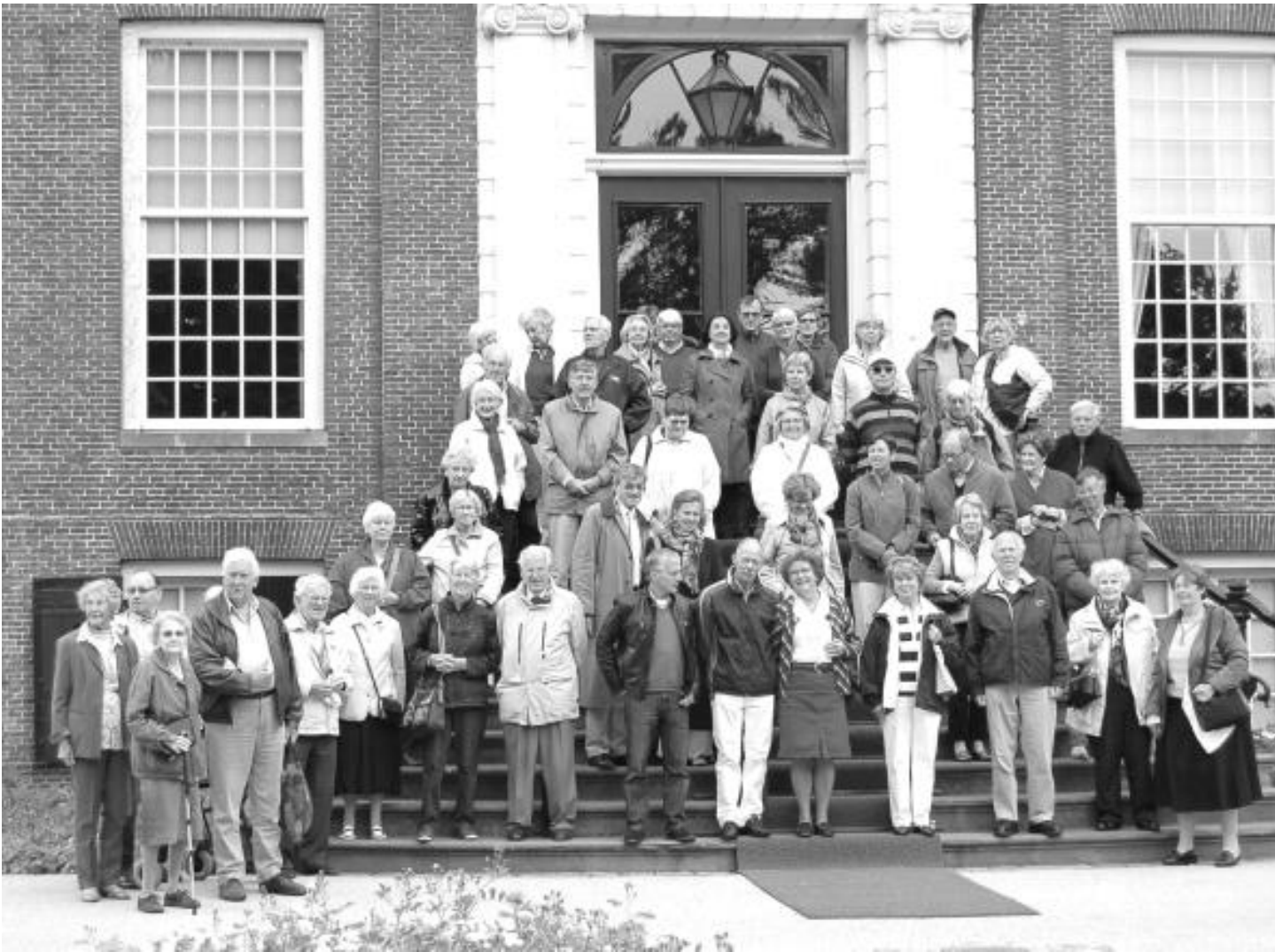
De deelnemers aan de excursie op 28 mei 2011.