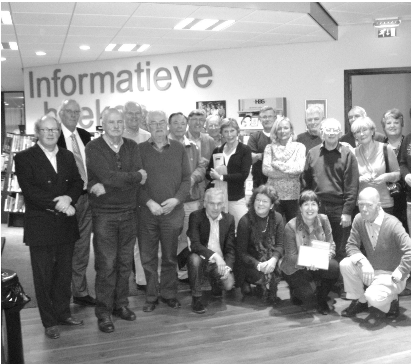
Cursisten, docenten en bestuursleden bijeen in de Bibliotheek aan de Langstraat na het afsluiten van de cursus over de geschiedenis van Wassenaar.

In het najaar vond wederom een herhaling plaats van de in 2008 voor het eerst gegeven cursus over de geschiedenis van Wassenaar. Ook nu gebeurde dit in samenwerking met het Gemeentearchief Wassenaar en de Stichting Historisch Centrum Wassenaar. Aandacht werd geschonken aan onderwerpen als archeologie, buitenplaatsen, het ontstaan van de villawijken, huizenonderzoek en het lezen van oud schrift. Op de laatste middag ontvingen de cursisten een certificaat en was er een feestelijke afsluiting van de cursus in aanwezigheid van de docenten en bestuursleden van Oud Wassenaar. Evenals vorig jaar waren de reacties der deelnemers erg positief.