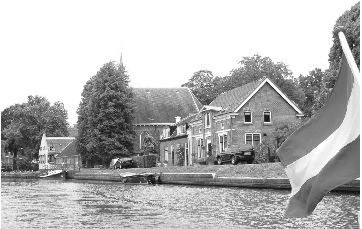
Varen over de vecht, Excursie 28 mei 2011.