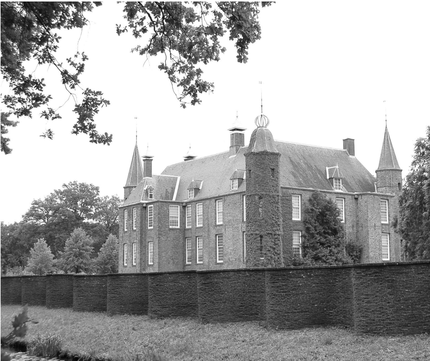
Slot Zuylen, excursie 28 mei 2011.

Bij het secretariaat kwamen (afgezien van e-mails met verzoeken om uiteenlopende informatie) ca 60 stukken binnen, terwijl ca. 20 brieven (waarvan acht rondschrijvens) uitgingen.